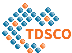
Table de développement social des Collines-de-l'Outaouais